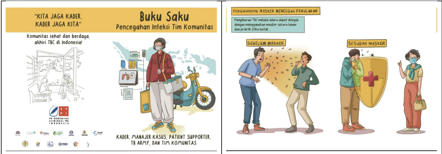
Desain Media KIE tersedia di tautan berikut: https://bit.ly/4bpEZqy