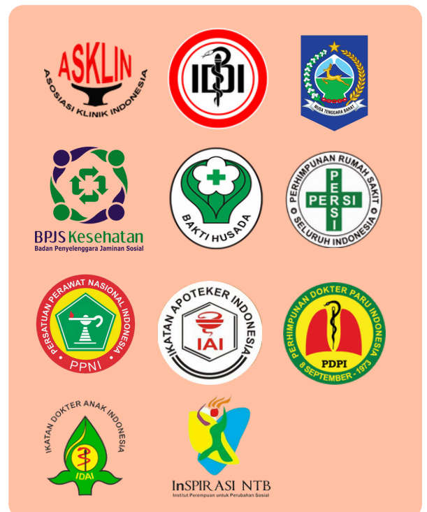
SR Provinsi dan SSR kabupaten/kota

Menjalankan aktivitas program TBC Komunitas pada 6 Kab/Kota pada wilayah kerja PKBI Daerah NTB yakni Sumbawa, Bima, Lombok Tengah, Lombok Timur, Lombok Barat dan Kota Mataram.