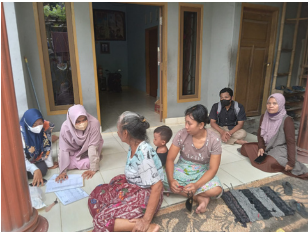
Penyuluhan TBC di Lingkungan Masyarakat

Perkumpulan Keluarga Berencana Indonesia (PKBI) adalah lembaga swadaya masyarakat yang bekerja menangani isu-isu kependudukan di Indonesia.